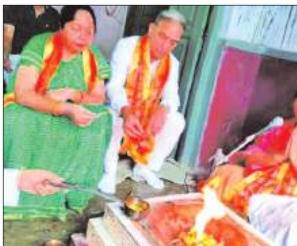
ऋषि दयानन्द के 200 साल पूरे होने के साथ समविश्वविद्यालय में आर्यसमाज की गतिविधियों को नया आयाम दिया जायेगा। आर्यसमाज के प्रचार-प्रसार करने वाले युवाओं के ठहरने लिए

उन्होंने आर्य समाज की नवीन यज्ञशाला, आर्य समाज भवन के जीर्णोद्धार की नींव रखी।