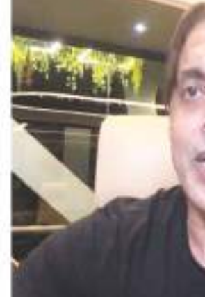
कम गति से गेंदबाजी कर रहा हूँ, लेकिन मैं 145 किमी प्रति घंटे

बस इतना ही। मेरा मतलब है कि पहले ही मैं 135 किमी प्रति घंटे से की रफतार को कोसूंगा। तो वह गायब है।' शाहीन ने रण स्ट्रेज में टीम इंडिया के खिलाफ पहले मैच के दौरान बल्लेबाजी क्रम को तहस-नहस कर दिया था। तेज गेंदबाज ने रोहित शर्मा, विराट कोहली, हार्दिक पंड्या और रवींद्र जडेजा के महत्वपूर्ण विकेट लिए और अपने 10 ओवरों में 3.50 की शानदार इकॉनमी से केवल 35 रन दिए जिसमें दो मैडन ओवर भी शामिल थे।