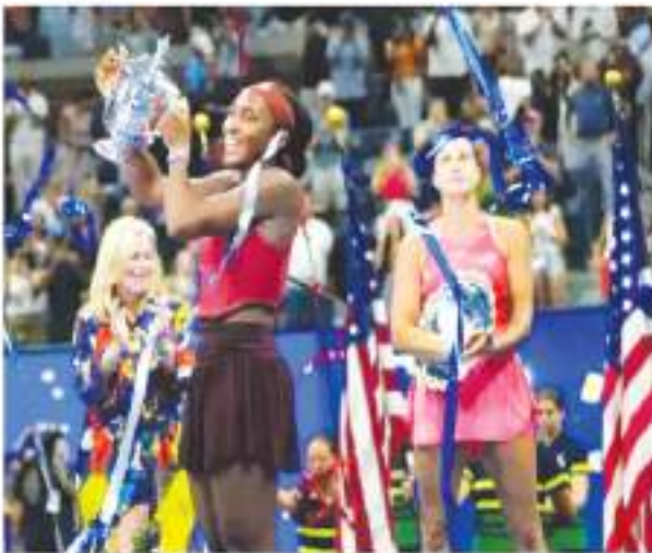
मुकामले की शुरुआत अच्छी नहीं रही। सवालेंका ने पहले सेट को 6-2 से अपने नाम किया। इसके बाद दूसरे सेट में कोको ने

न्यूयॉर्क। अमेरिका की 19 वर्षीय कोको गॉफ यूएस ओपन 2023 की चैंपियन बन गई हैं। कोको ने यहां आठवें एसे स्टेडियम में हुए फाइनल मुकाबले में शानदार प्रदर्शन करते हुए बेलायस की अरीना सवालेंका को शिकस्त दी। कोको के करियर का यह पहला ग्रैंडस्लैम खिताब भी है। स्थानीय मीडिया रिपोर्ट्स में यह जानकारी दी गई।